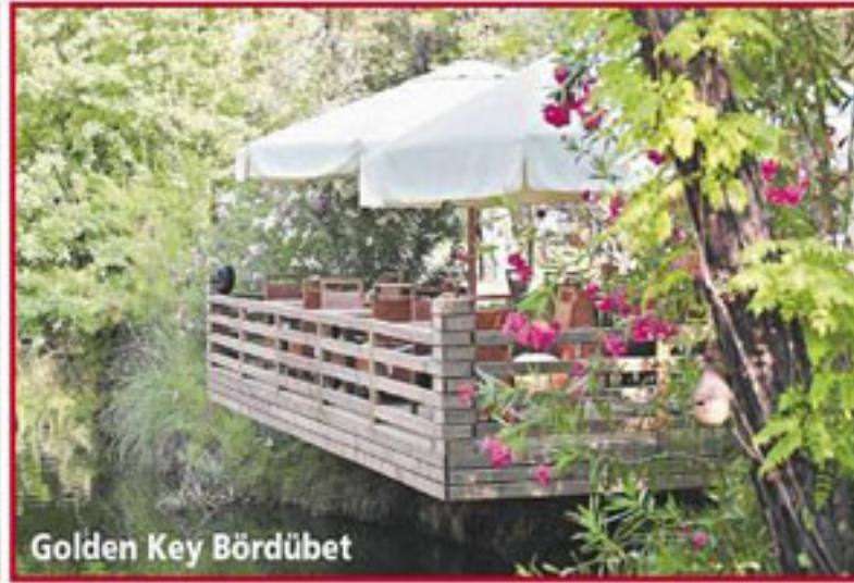
Golden Key Bördübet